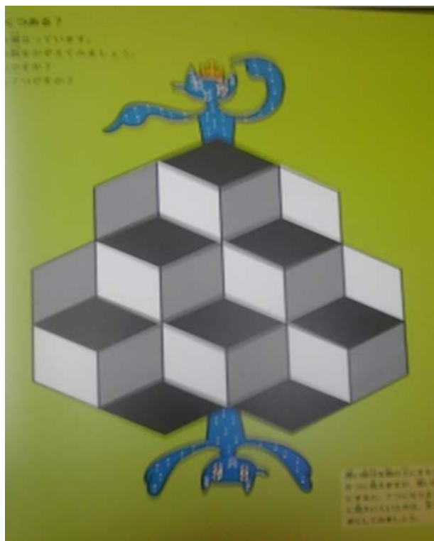
図3：いくつにみえますか

子どもたちは、その学年通りに発達してきている訳ではないからだ。子どもたちの「認知特性」を理解した上での指導・支援が今後ますます必要となるだろう。