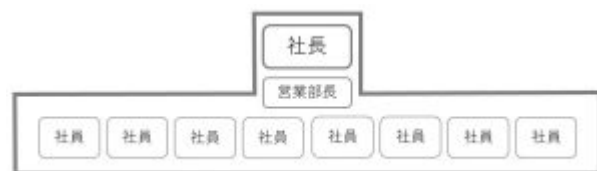
図 3 鍋蓋型の組織図

ピラミッド型組織であれば、ワインタワーのてっぺんのグラスに注がれたワインのように、良くも悪くも上からの指示や命令は順番に下に流れていく。しかしながら、鍋蓋型の組織ではそのようにはならないのは、容易に想像がつくだろう。