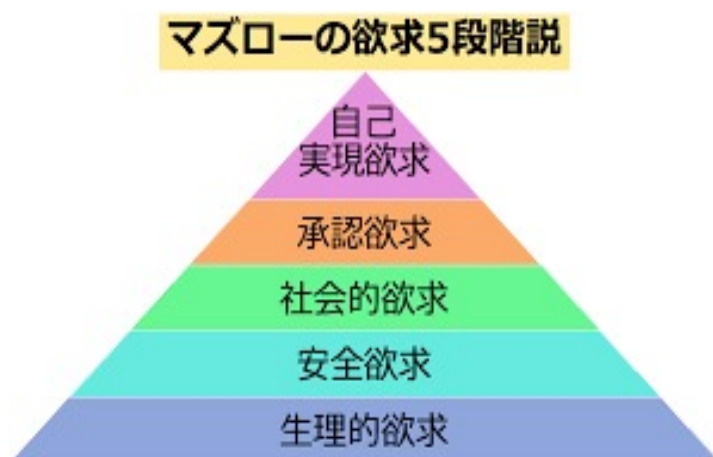
図1 マズローの欲求段階

この脳の危機管理の仕組みは、マズローの欲求段階説で考えると下から3番目の「社会的欲求」にあたる。この根源的な欲求を破壊されると「いじめ」による自殺のように人は死んでしまう。つまり、その組織（集団）でうまく過ごしてわが身を守らないと、命（安全・安心）にかかわることだともいえる。